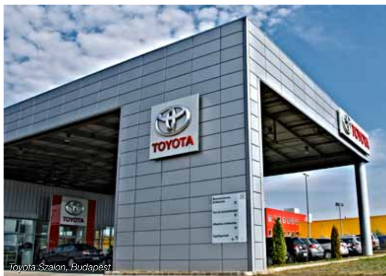
Toyota Szalon, Budapest

különböző szélességi és magassági méretekben, többféle bevonat és szín közül választható ki az épülethez és a vevői igényekhez legjobban illeszkedő kazettás burkolat. A kazettákkal együtt az egyedi sarokmegoldások és illesztések adják meg a termék tökéletes homlokzati összhangját.